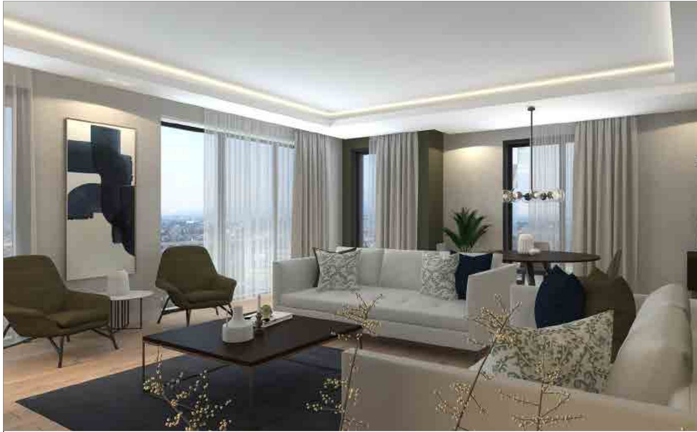
Dublex Daireler (5+1, 4+1)