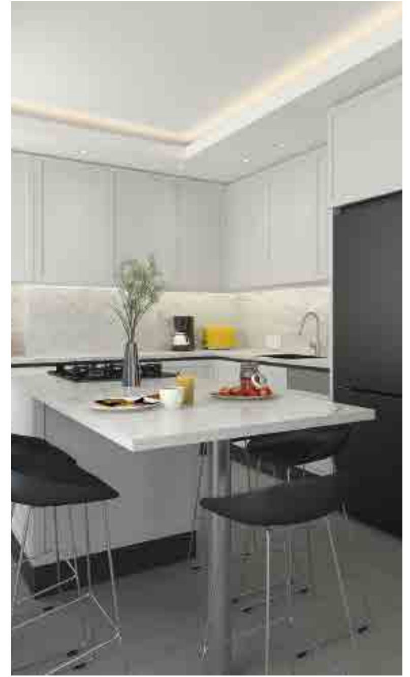
Dublex Daireler (5+1, 4+1)